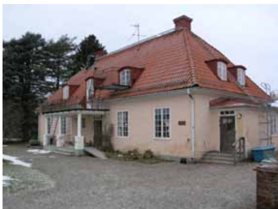
Hed - förskolan

Innebär situationen att man ej kan vara i St Davidsgården/Skinnskattebergs tätort, finns följande alternativ att undersöka som alternativ: