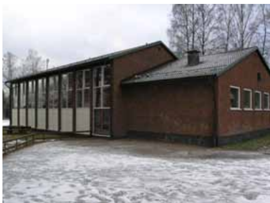
Riddarhyttan - gymnastiksal