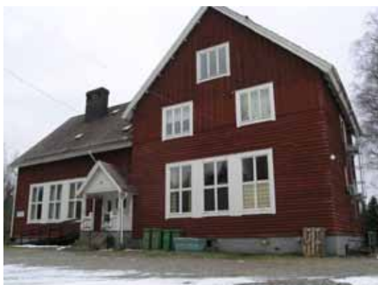
Baggbron - allaktivitetshuset