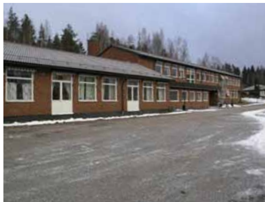
Riddarhyttan - skolan