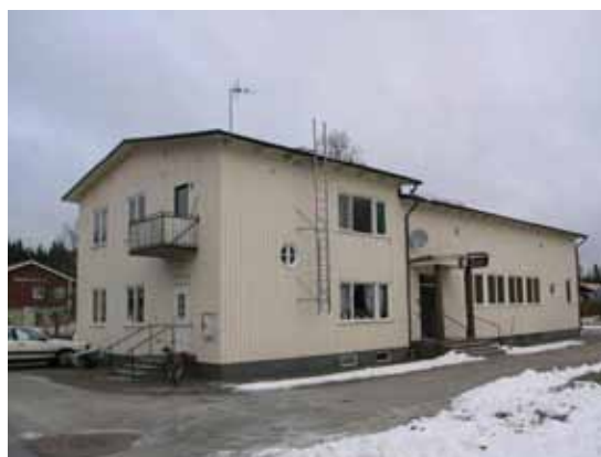
Riddarhyttan - allaktivitetshuset