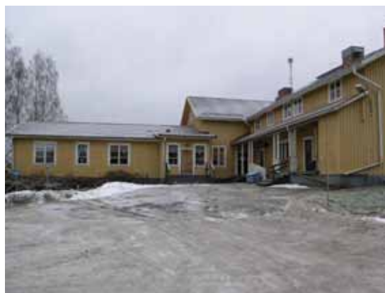
Färna - förskolan