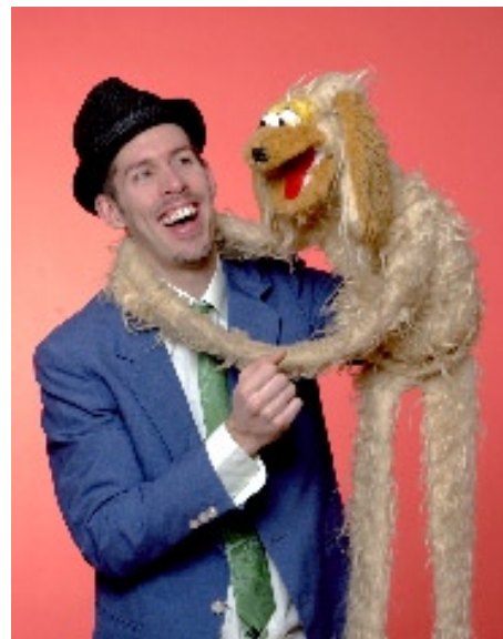
Filiokus Fredrik med kollega

Grattis Skinnskatteberg, ni är bäst i Sverige!