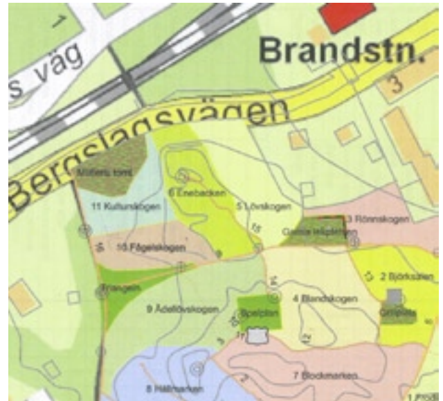
Del av karta från inventeringsmaterialet

Det finns en tydlig målsättning med området mitt i byn, bl. a. -att sköta och utveckla Klockarberget med hänsyn till dess naturliga förutsättningar och sociala möjligheter -att göra området attraktivt att vistas i för alla besökare och därmed genom olika åtgärder och förutsättningar medverka till en förbättrad livskvalitet.