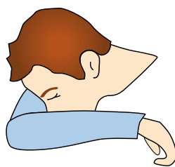
Hosta och nysa i armvecket