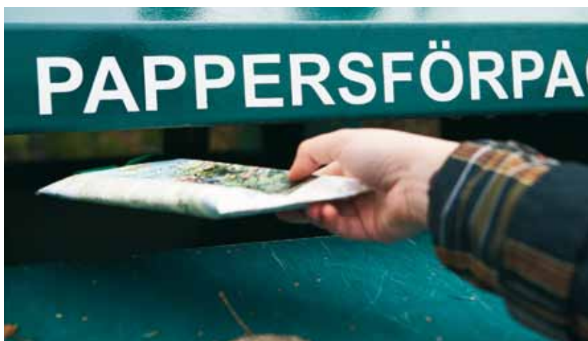
En gammal kartong blir en ny kartong - om du lämnar den till återvinning.

T ex ketchupflaska, glassbytta, schampoflaska och plastlock. Sorteras manuellt. Mals ned och säljs till återvinningsindustrin för att bli pulkor, häststaket, parkbänkar och rör.