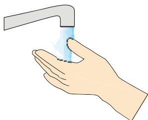
Tvätta händerna ofta