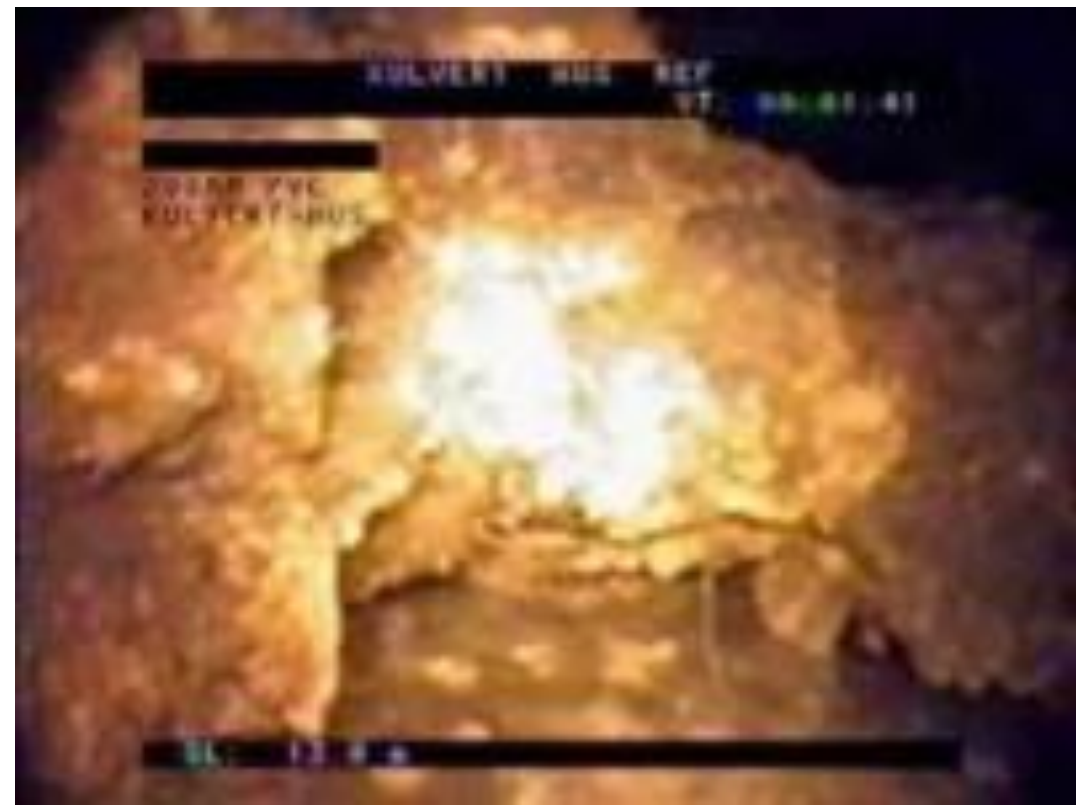
Film från vvsforum.se